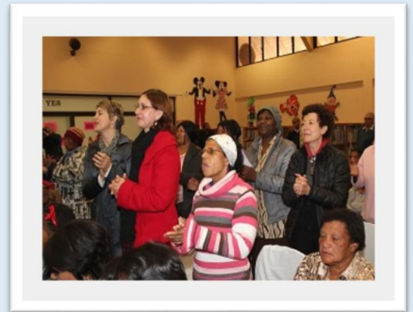
Dekaan kry staande applous na haar toespraak