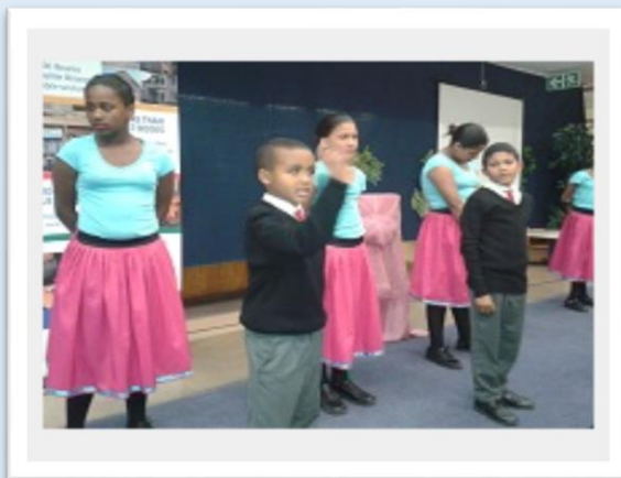
Parkview Primêr leerders voer Sharpeville op