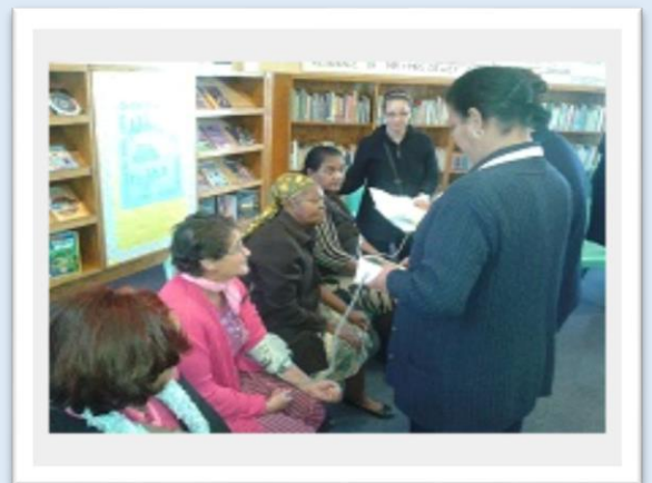
World Vision verskaf gratis gesondheidsdienste