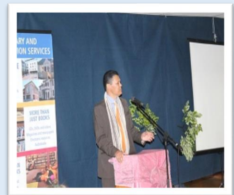
Voorsitter van die ATR verwelkom almal